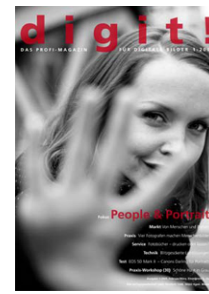
digit! Ein Magazin der PhotoPresse Suchmaschinenoptimierung für Fotostudios